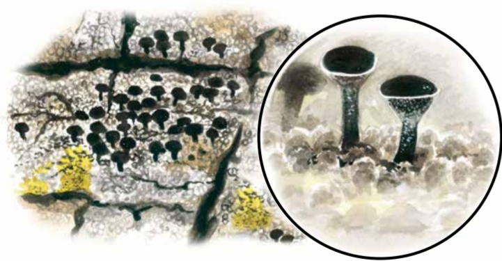
Ekspik ( Calicium quercinum ). Området är känt för en rik flora av ovanliga lavar. Det är en följd av att gamla solbelysta ekar och andra lövträd funnits här under mycket lång tid. Ekspiken är en av de mest sällsynta men också almlav, gul dropplav och lunglav växer i området.

Miljöer med gamla ekar tillhör de mest artrika i Sverige. Samtidigt hotas de ofta av igenväxning. För att behålla naturvärdena i Stafsaäter görs olika skötselinsatser. Exempel på åtgärder är röjning kring igenväxta träd och att medvetet skada vissa för att efterlikna strukturer som normalt finns i äldre träd. Boplatser för arter som lever i ihåliga träd sätts också upp.