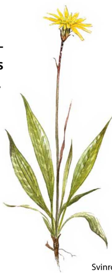
Svinrot ( Scorzonera humilis ). I de allra öppnaste delarna av de betade hagmarkerna finns rester av äldre tiders ängsflora. Här växer till exempel svinrot tillsammans med smörboll, darrgräs, prästkrage och många fler.

Markerna runt Stafsaäter har varit bebodda under mycket lång tid. Förr användes de ytor som inte plöjdes som slåttermark eller betesmark. Det var ett brukat landskap, men betydligt öppnare och ljusare än idag. Ekarna kunde växa sig stora och vidkroniga och slåtern och betet gjorde gräsmarkerna artrika.