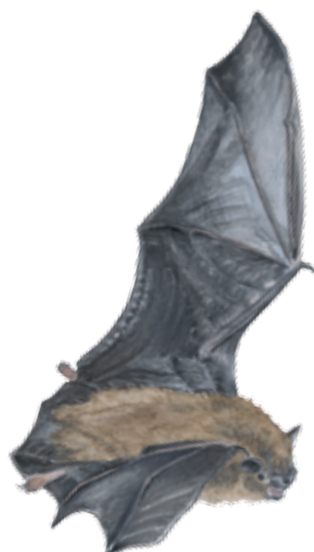
Dvärgfladdermus Pipistrellus pygmaeus