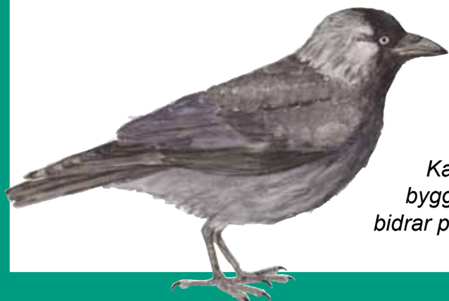
Kajan (Corvus monedula) bygger gärna bo i mulmholken och bidrar på så sätt till att skapa mulm.

Läderbaggen (Osmoderma eremita) är sällsynt och förekommer endast i områden med mycket gamla, ihåliga ädellövträd. Mulmen är boplats åt dess larv i tre år. Den visar genom sin förekomst att miljön är mycket värdefull och att artrikedomen av andra vedlevande skalbaggar är hög.